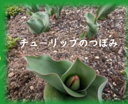
チューリップのつぼみ

さて！問題です チューリップの球根をいくつ植えたでしょうか 答えは裏面の下にあります