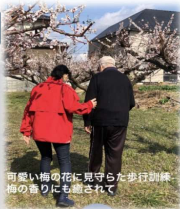
可愛い梅の花に見守られた歩行訓練 梅の香りにも癒されて