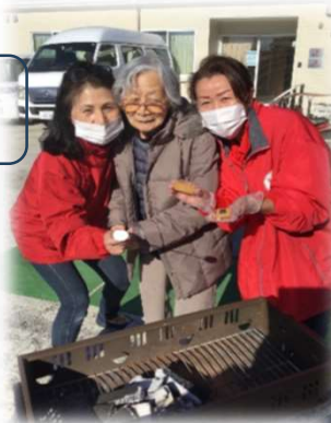
マシュマロを 焦がさずに 焼いてね！