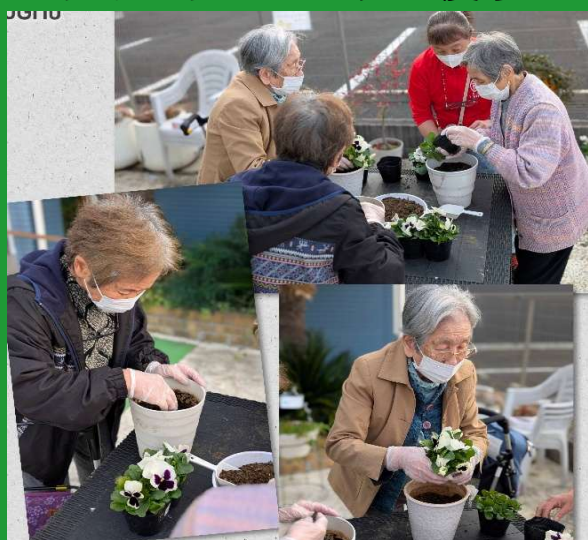
冬の花に模様替え