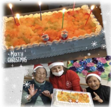
ちょっとロマンチックだった クリスマス