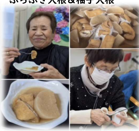
無病息災祈願！ 今年も大根炊きを食べ