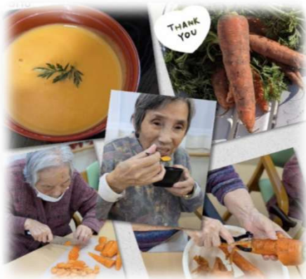
人参ポタージュスープ