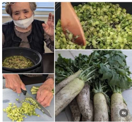
大根葉のふりかけ