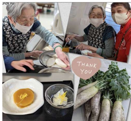
ふろふき大根&柚子大根