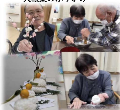
ヴィレッジ流お餅つき 鏡もち&花餅作り