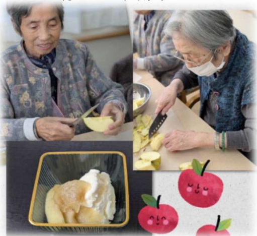
2026初おやつは！ バニラアイスの リンゴのコンポート添え